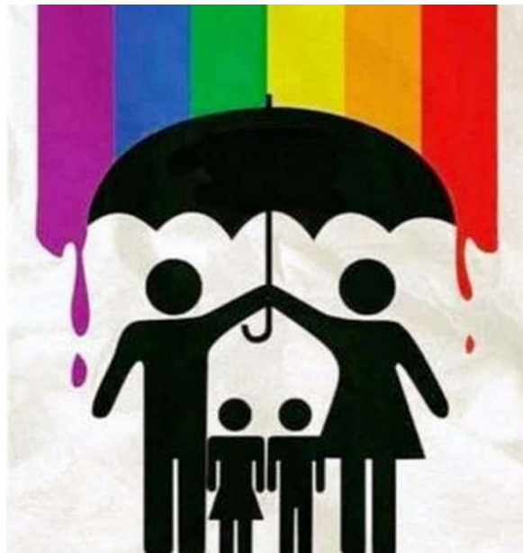
Crianza rusa resumida en una foto

Cualquiera que sea el caso, las leyes en Rusia apoyan actualmente este punto de vista de la mayoría rusa. Por lo tanto, la propaganda homosexual dirigida a menores de edad es ilegal y las parejas homosexuales no son libres de adoptar niños. Y, por último, pero no menos importante, el llamado “desfile del orgullo gay” ha sido prohibido en muchas ciudades rusas, incluso durante los próximos 100 años en Moscú, algo que apoyo con entusiasmo por las razones que describí en este artículo .